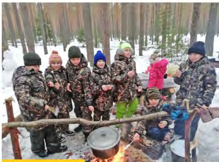
2 «А» класс