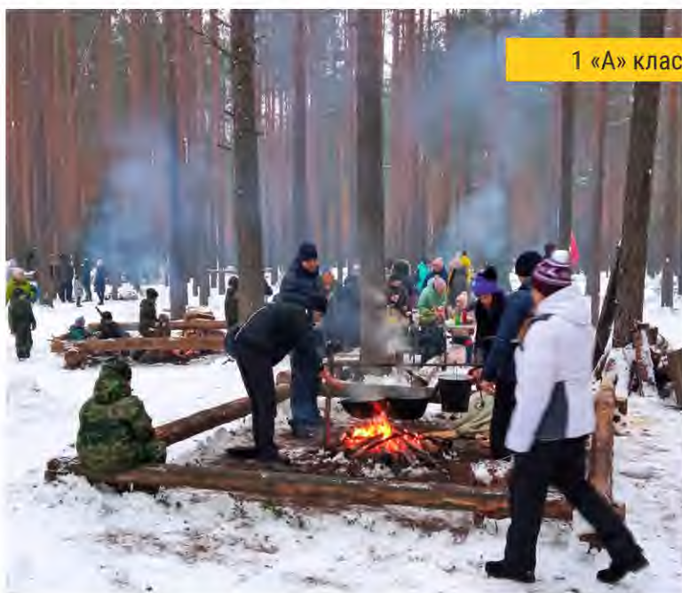
1 «А» класс

27 ноября для кадетских классов проводилось мероприятие на открытом воздухе – День здоровья, направленное не только на укрепление физического состояния, но и на сплочение коллектива. В Дне здоровья принимали участие как дети, так и взрослые. Участники мероприятия дарили друг другу положительные эмоции, проявляли силу и выносливость при прохождении испытаний, учились командной работе.