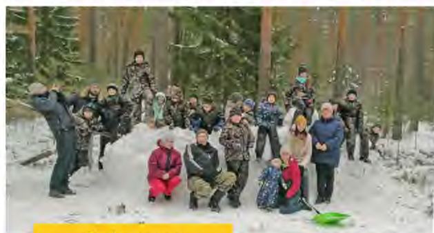
3 «А» класс